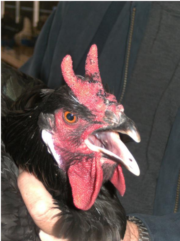
Assez bonne tête de coq La Flèche

La queue en jalousie se détecte assez tôt. On observe alors que les deux plumes supérieures de couverture de la queue ont leur extrémité tournée vers l'extérieur et les rectrices ne sont pas implantées en forme de toit dans la queue, mais elles sont horizontales. De tels sujets sont à éliminer, car ils obtiendront le pointage " 0" en exposition.