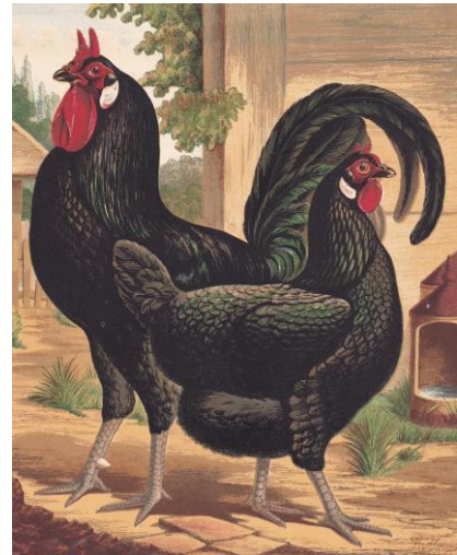
Couple de La Flèche de W.C.W. Fitzwilliam , 1 er prix à Wolverhampton en 1871

Le constat que la La Flèche présente toujours un angle de queue plutôt fort répond à une caractéristique raciale. Le standard fixe qu'elle peut atteindre l'angle droit. La queue doit être aussi pleine que possible, avec de grandes faucilles larges