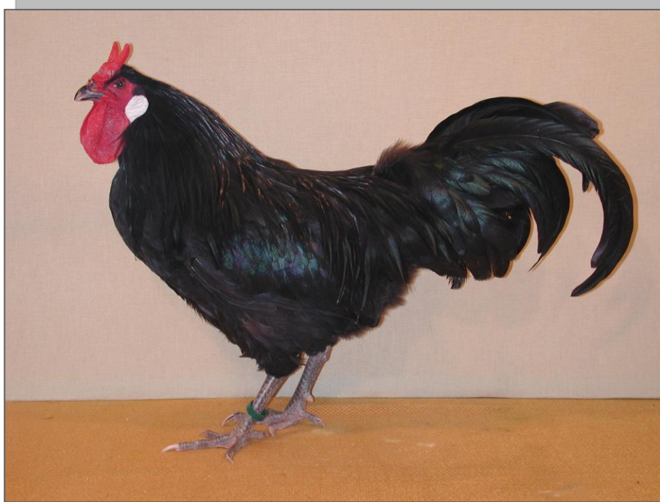
Coq un peu bas sur pattes, mais avec un belle ligne de dos.

Cette belle volaille française "améliorée" ne passe jamais inaperçue, ne serait-ce qu'en raison des cornes qui lui servent de crête et lui donnent un air quelque peu diabolique.