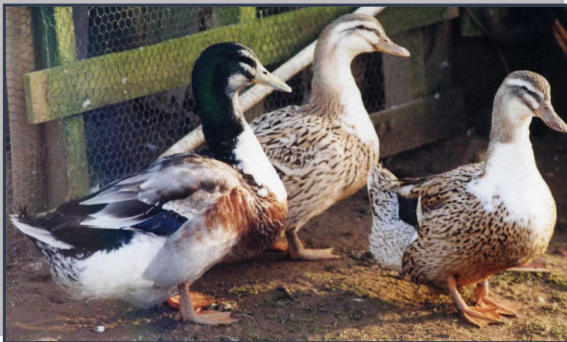
Trio de canards de Challans, l'on remarque bien le dessin caractéristique de la tête du mâle et le plastron en forme de coquille St Jacques.

L e canard de Challans connu aussi sous le nom de canard Nantais, a comme bien d'autres volailles françaises frôlé l'extinction. Rare en dehors de sa région d'origine, il tente grâce à quelques passionnés de garder la tête hors de l'eau, paradoxal pour un canard dont la réputation a largement dépassé les frontières de son pays.