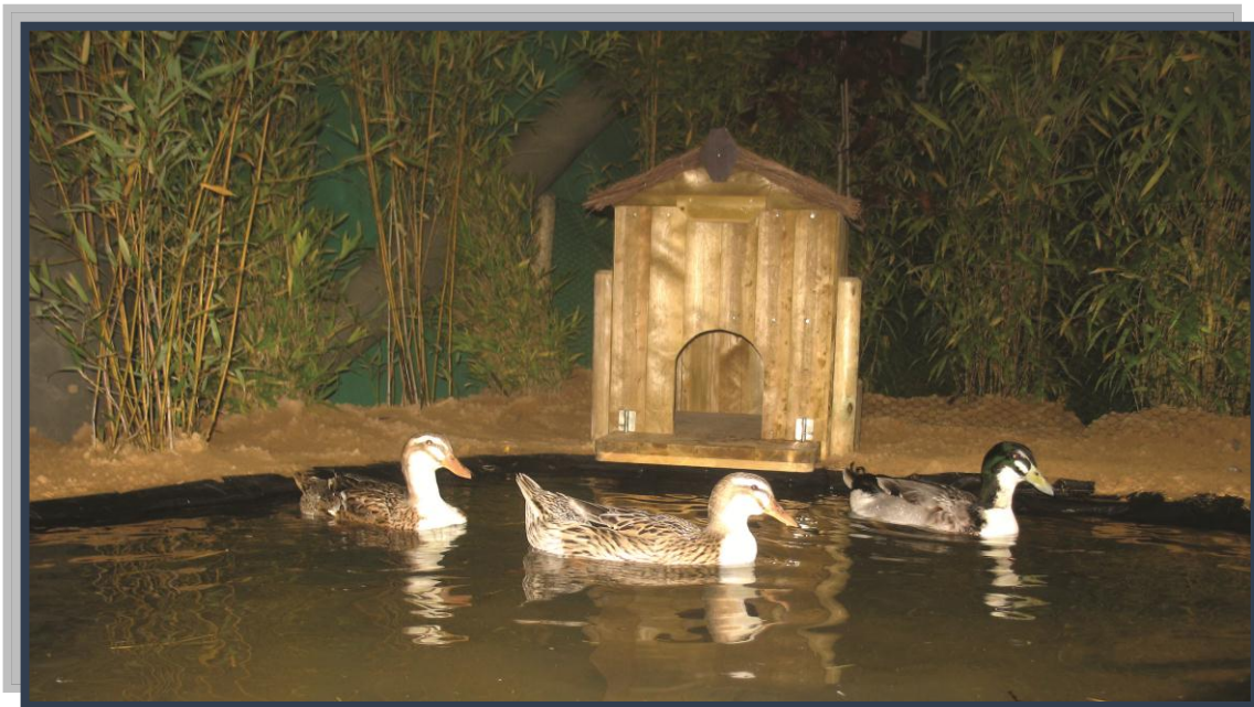
Moment de détente pour un trio de Challans